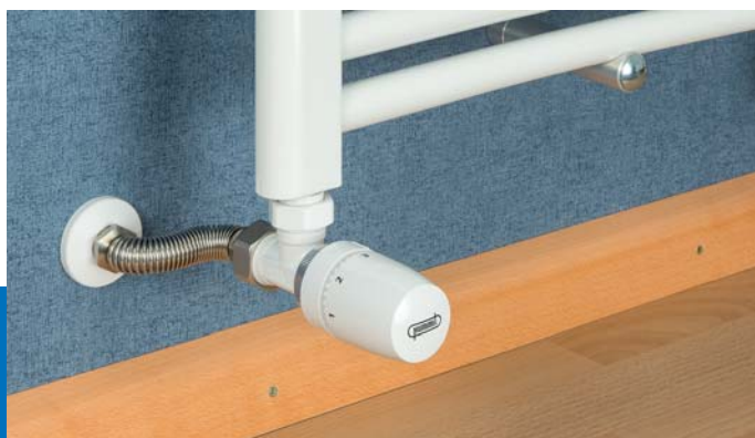
Flexibele radiatoraansluiting voor een inbouw lengte van 93 tot 143 mm