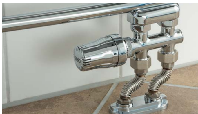
Flexibele radiatoraansluiting voor een inbouw lengte van 65 tot 95 mm