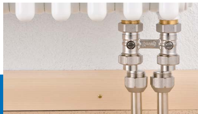
S-koppeling voor onderblokken met hartafstand verloop van 35 tot 65 mm